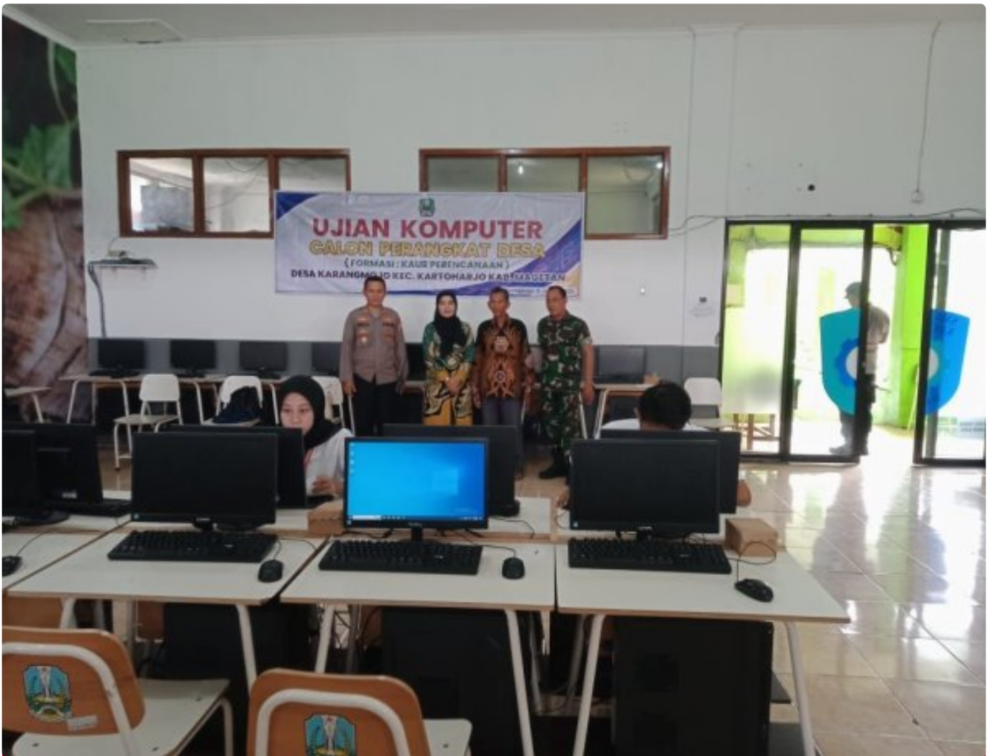
Danramil 0804/08 Barat Hadiri Penjaringan Ujian Praktek Komputer Calon Perangkat Desa Karangmojo

Magetan. – Komandan Koramil (Danramil) Tipe B 0804/08 Barat Kapten Inf