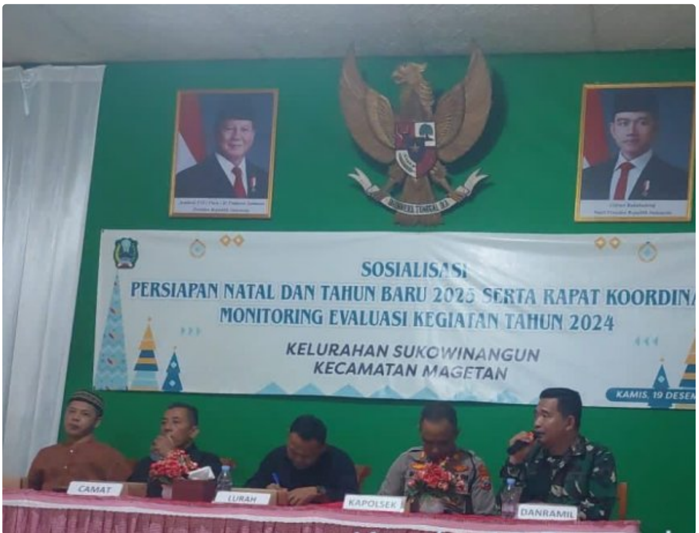
Danramil 0804/01 Magetan Bersama Forkopimca Hadiri Sosialisasi dan Persiapan Natal dan Tahun Baru 2025

Magetan. - Komandan Koramil Tipe B 0804/01 Magetan jajaran Kodim