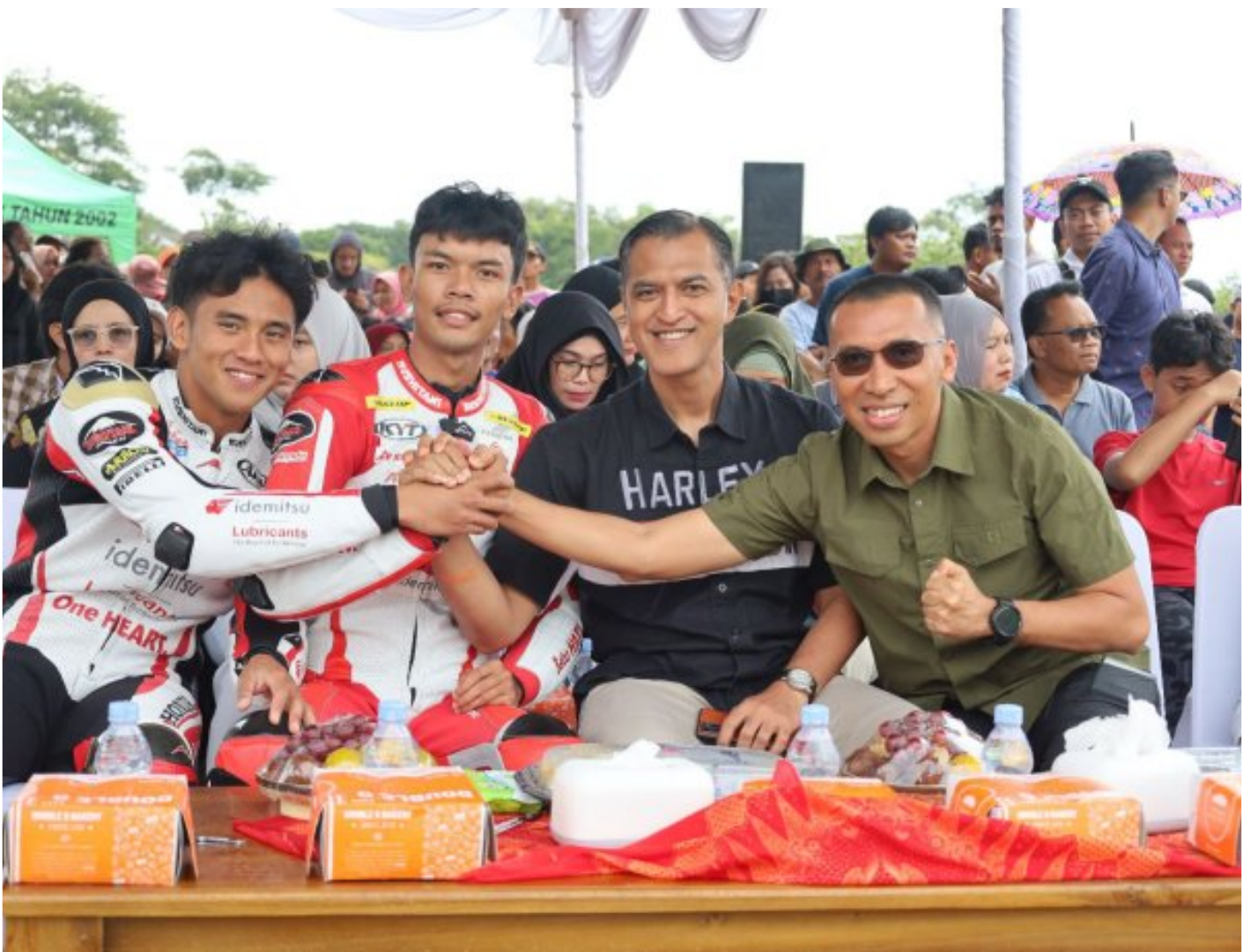
Dandim 0804/Magetan Hadiri Undangan Tinjau Sirkuit Magetan