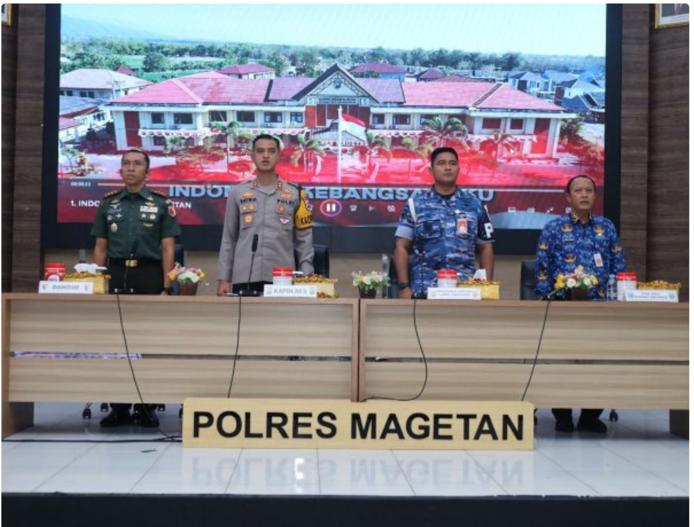
Dandim 0804/Magetan Hadiri Rakor Lintas Sektoral kesiapan operasi lilin 2024

Magetan. – Guna meningkatkan Sinergitas dalam rangka kesiapan operasi lilin 2024 pengamanan Hari Raya Natal 2024 dan Tahun Baru 2025 di wilayah Kabupaten Magetan yang aman dan kondusif.