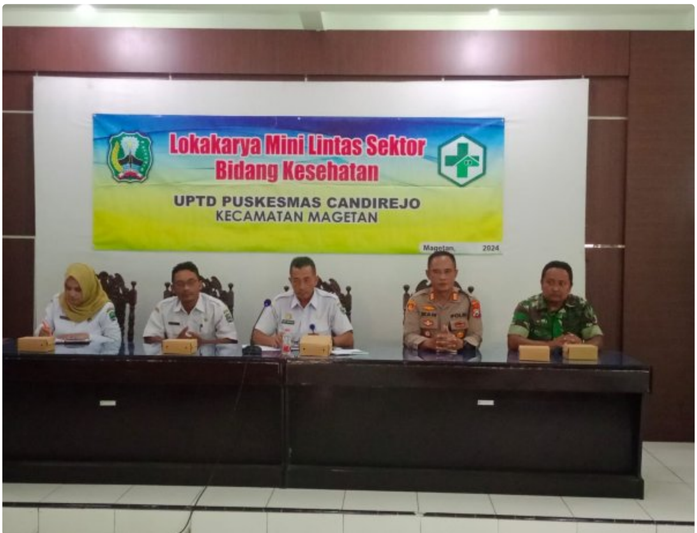
Bati TUUD Koramil 0804/01 Magetan Hadiri Loka Karya Mini Lintas Sektor Tri Bulanan Bidang Kesehatan