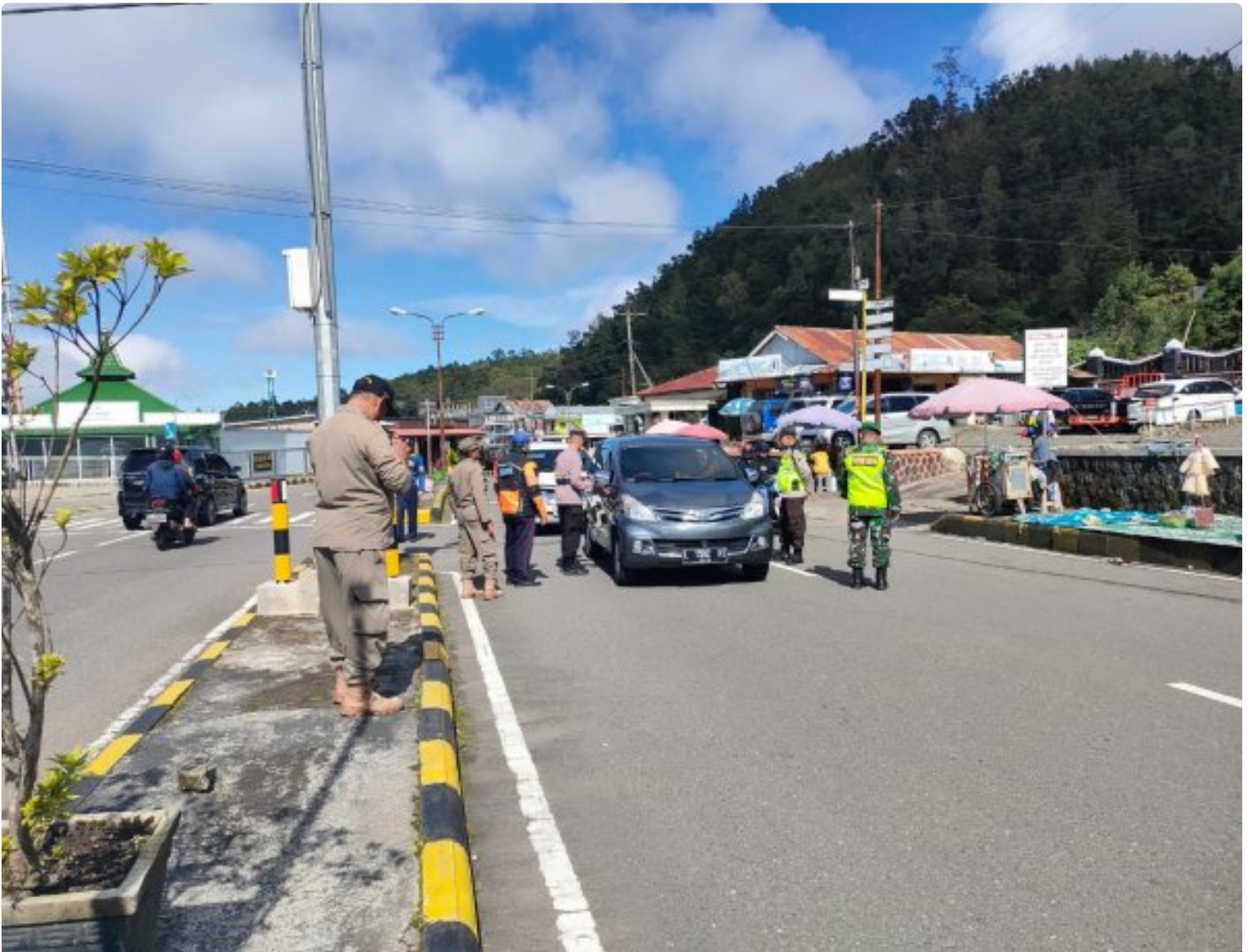
Anggota Koramil 0804/02 Plaosan Ikut Menjaga Pos Pengamanan Nataru di Wilayah Binaan

Magetan. - Anggota Koramil 0804/02 Plaosan bersama Anggota Polsek, Pol